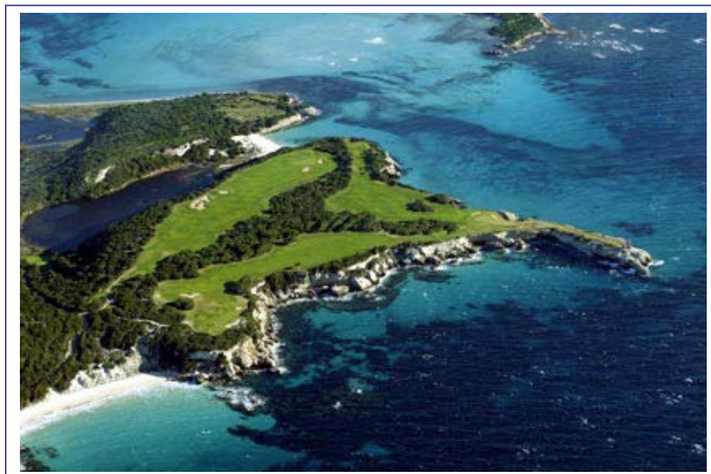
Trous n°14, 15, 16