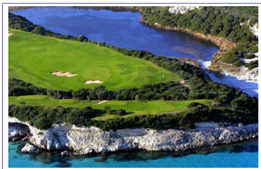
Green n°14 – Tee n°15