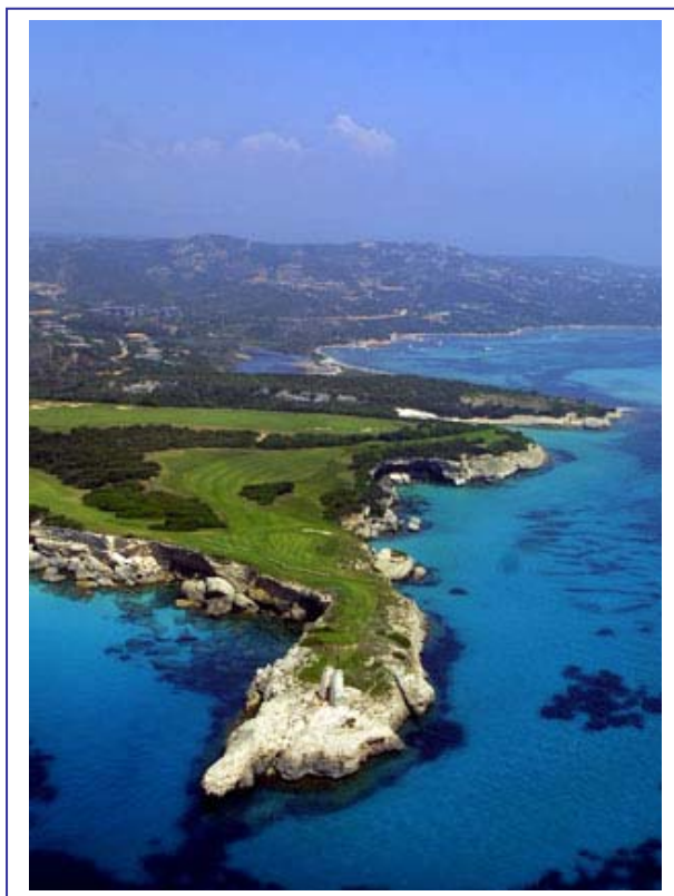
Pointe de Sperone

S.A. du Golf de Sperone – Domaine de Sperone – 20169 Bonifacio – France Tél : +33 4 95 73 17 13 – Fax : +33 4 95 73 17 85 Site web : www.sperone.com Edité le : 23/04/04